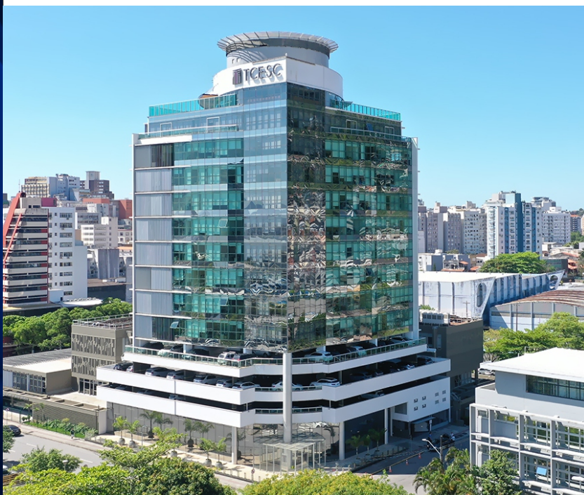
Figura 01: Prédio no TCE/SC

A Escola de Governo do TCE/SC, denominada Instituto de Contas (ICON), está localizada no centro de Florianópolis, no entorno da Praça Tancredo Neves (Praça dos Três Poderes), na Rua Bulcão Viana, 90, 1º andar, Bloco B do TCE/SC. A figura 01, abaixo, apresenta uma visão geral do prédio do TCE/SC.