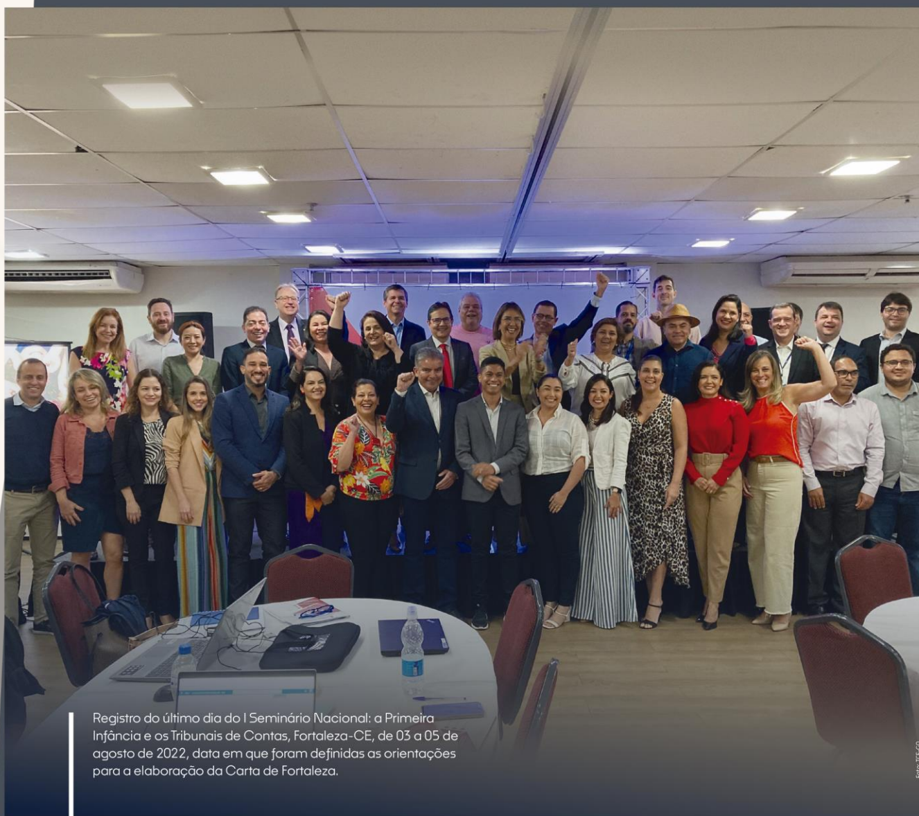
Registro do último dia do I Seminário Nacional: a Primeira Infância e os Tribunais de Contas, Fortaleza-CE, de 03 a 05 de agosto de 2022, data em que foram definidas as orientações para a elaboração da Carta de Fortaleza.